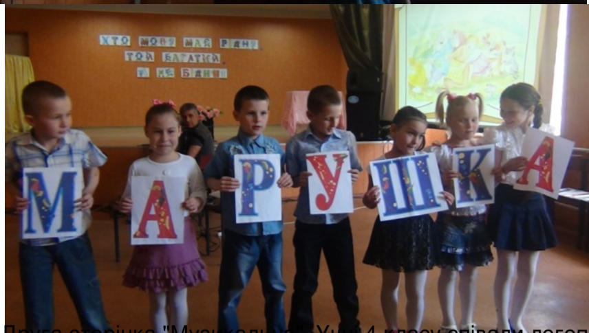
Діти з слайда "Музикально-Училища" читали логопедичні частівки про букви.