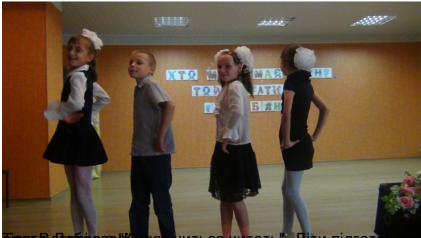
Діти в 5-б класі виступили з виставою "Хто мову має річу, той багатий не бідний". П'ять підготовчих класів інсценували однойменний