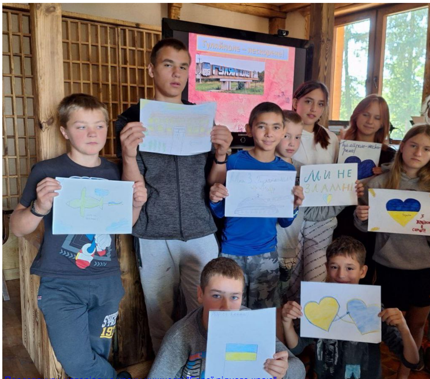
Переглянути матеріали з уроку мужності "Герої рідного краю"